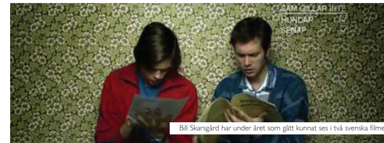
Bill Skarsgård har under året som gått kunnat ses i två svenska filmer