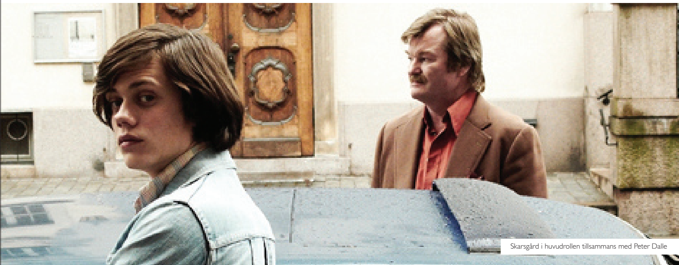
Skarsgård i huvudrollen tillsammans med Peter Dalle